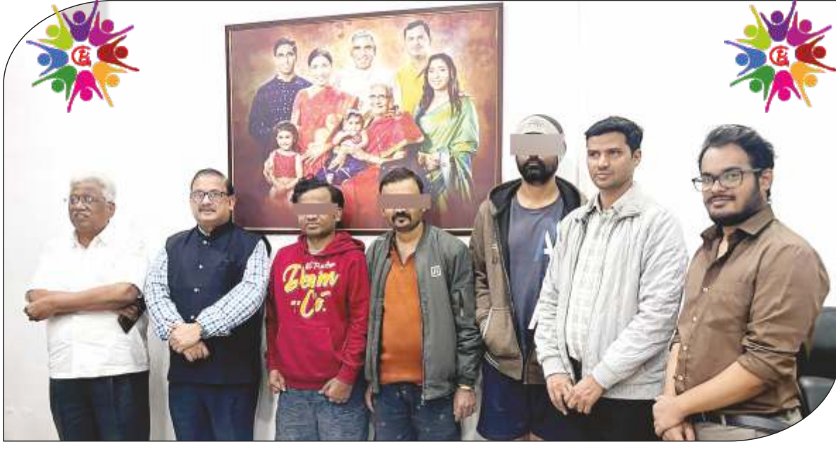
रूग्णासमवेत तज्ञ डॉक्टर आणि त्यांची टीम छायाचित्रात दिसत आहे.