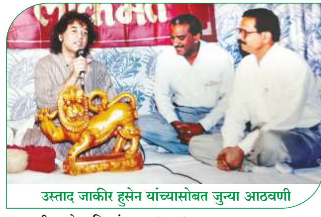
उस्ताद जाकीर हुसेन यांच्यासोबत जुन्या आठवणी

सवलतीचा पोष्ट रजि. नं. JAL/120/2022-2024